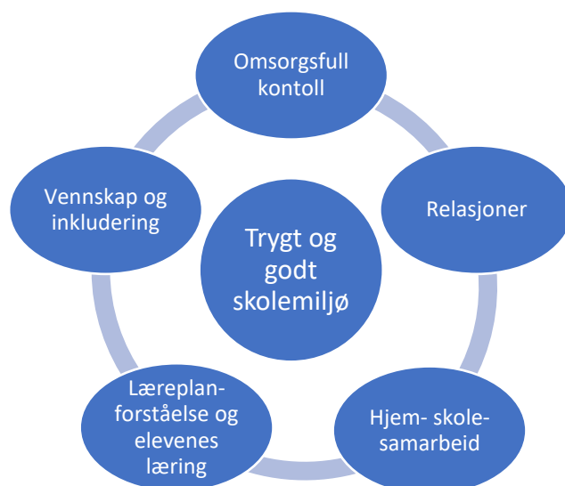
Analyse og arbeidsmodell, Trygt og godt skolemiljø (Bergkastet m.fl., 2019).

I det kontinuerlige arbeidet med trygt og godt skolemiljø, bruker vi følgende analyse- og arbeidsmodell for å få fanget opp samspillet mellom ulike kategorier som sammen har betydning for elevenes opplevelse av et trygt og godt skolemiljø: